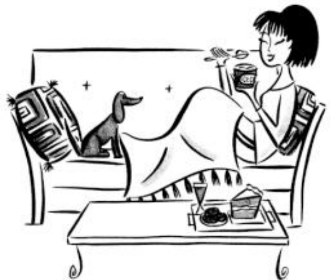
Illustrazioni tratte dal libro di Brian Wansink, Mindless Eating – Why we eat more than we think , Bantam Dell, 2006