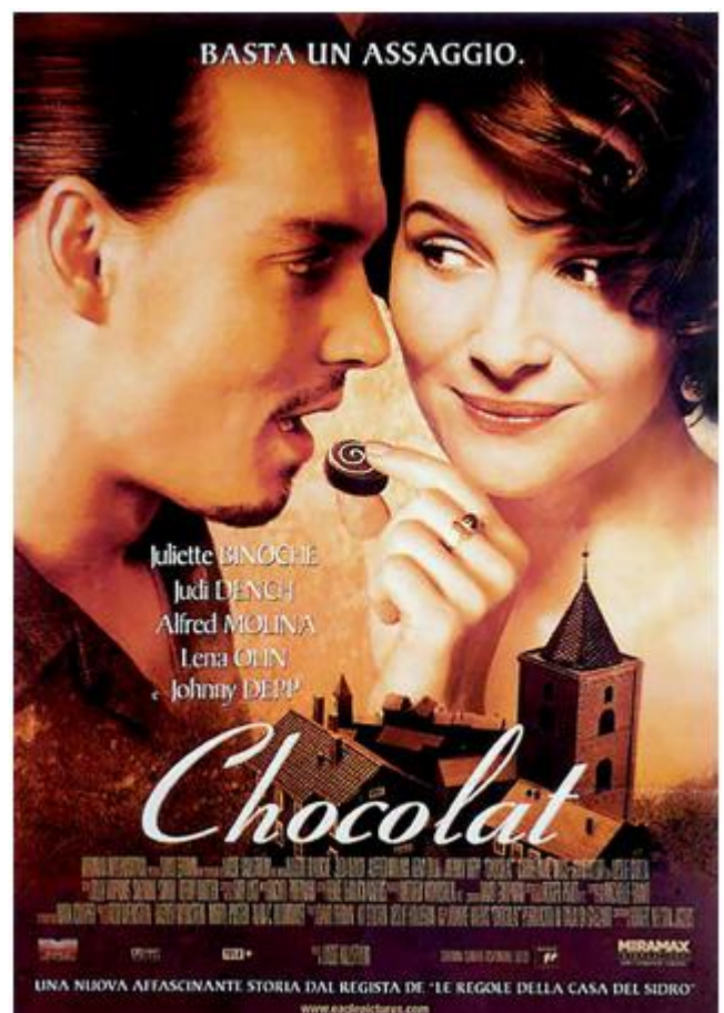
Chocolat di Lasse Hallström, Gran Bretagna-USA 2000

Per ciò che concerne gli stimoli di natura psicologica, essi sono legati alla storia alimentare del singolo combinata all'ambiente nel quale esso vive che provoca impulsi emotivi, positivi o negativi che siano.