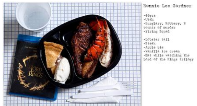
Henry Hargreaves. No Seconds, Comfort Food e Fotografia, Museo della Follia, Isola di San Servolo

L'eccentricità, la leggerezza, l'abbagliante splendore della musica pop e di coloro che la portano sui palchi e la disperazione, il dolore, l'odio, la paura, la morte sono accostati all'interno del medesimo evento: l'arte è il mezzo, il cibo è il fine e viceversa. In questo reciproco scambio di energie il Comfort Food conferma la propria trasversalità, la capacità di riguardare ogni essere umano in un momento parossistico positivo o negativo e di legarsi all'anima di una persona, sia essa leggera come il sogno di un bambino o pesante come una montagna, e di trasportarla, anche solo per un attimo, in una dimensione edonistica dove la natura dell'anima stessa è messa a nudo e vive nella più totale autenticità.